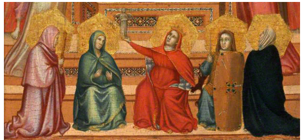
B. La Vergine e il Bambino