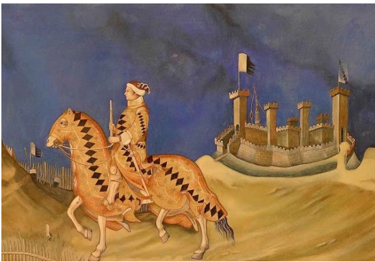
C. Guidoriccio da Fogliano