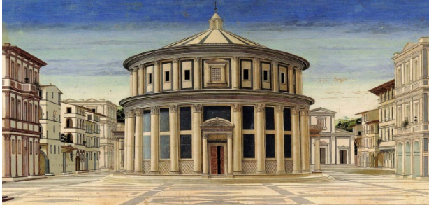
A. La città ideale